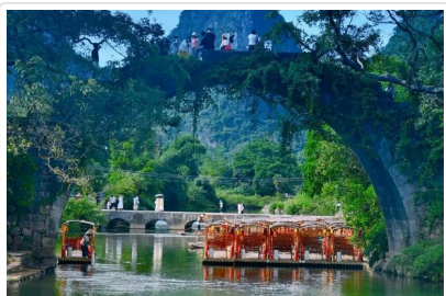
遇龍河竹筏漂流 富里橋