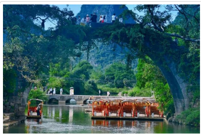
遇龍河竹筏漂流 富里橋