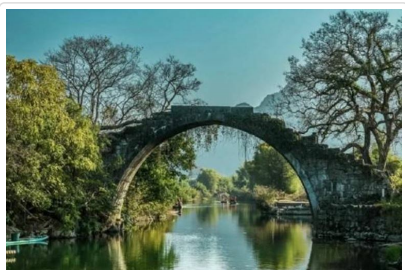
遇龍河竹筏漂流 富里橋