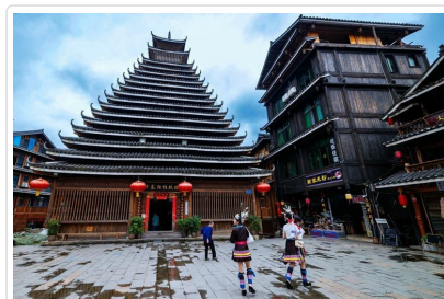
程陽八寨 侗族鼓樓

行車距離 桂林 - 程陽八寨景區 車程約2小時 / 程陽八寨景區 - 三江 車程約30分鐘