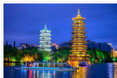
夜船遊四湖 日月雙塔

特殊安排 夜船遊四湖安排★專屬包船，免去與其他團體共乘的喧擾，搭配★茶點，讓您在航程中邊品茶點邊賞景，細細品味桂林的夜之美。