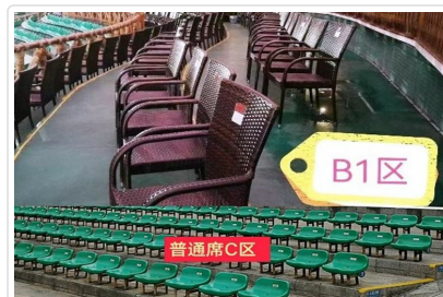
劉三姐B1席(圖上)一般席(圖下)

特殊安排 灘江遊船特別指定第二層座位，視野極佳，是拍攝山水美景和感受船在江中走，人在畫中游的絕佳位置。