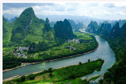
相公山 俯瞰瀘江第一灣

特殊安排 特別安排★專車運送行李，將貴賓們的大件行李從陽朔運送到深圳，貴賓可以輕鬆的進出高鐵站，不用手提行李上下車、放置行李，影響乘車的舒適感。也請貴賓先行準備今晚的過夜包，因為大件行李需要提前一天運送!!