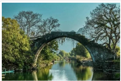
遇龍河竹筏漂流 富里橋