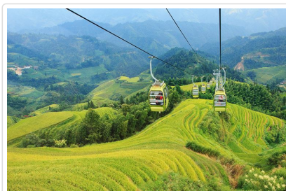
龍脊 金坑梯田 金佛頂纜車