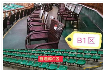
劉三姐B1席(圖上)一般席(圖下)

特殊安排 灘江遊船特別指定第二層座位，視野極佳，是拍攝山水美景和感受船在江中走，人在畫中游的絕佳位置。