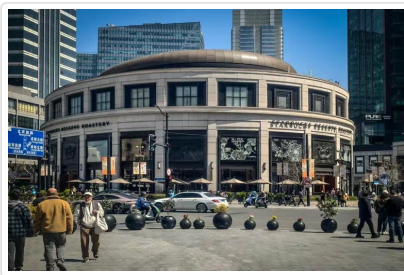
星巴克臻選烘焙工坊

活態度。隨後參觀位於上海南京西路興業太古匯的◎The Louis 路易號(外觀打卡)，是一座全球獨一無二的巨型郵輪造型品牌展覽裝置，迅速成為城市熱門打卡新地標。◎南京路步行街位於上海市黃浦區，是上海最著名的購物街之一，有著「中華商業第一街」的美譽，東起外灘，西至西藏中路。步行街集購物、美食、文化展示於一體，既有永安、先施等老字號商店，也有眾多現代化商場。傍晚登上遊船★船遊黃浦江+外灘夜景，當遊船緩緩駛過，兩岸外灘萬國建築群與陸家嘴的璀璨摩天大樓交相輝映，燈火輝煌，盡顯上海的摩登與繁華，感受東方明珠的無限魅力。